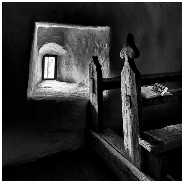
Monika Rösler - Kirchenbank

Bilder der FFVC-Fotografen, die eine Urkunde erhalten haben.