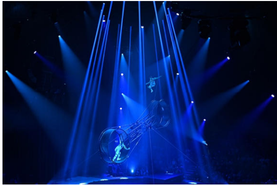
Herbert Bauer – FlicFlac

Bilder der FFVC-Fotografen, die es bis zu den Annahmen geschafft haben.