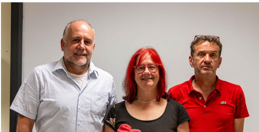
die Juroren der BSW Fotogruppe Würzburg