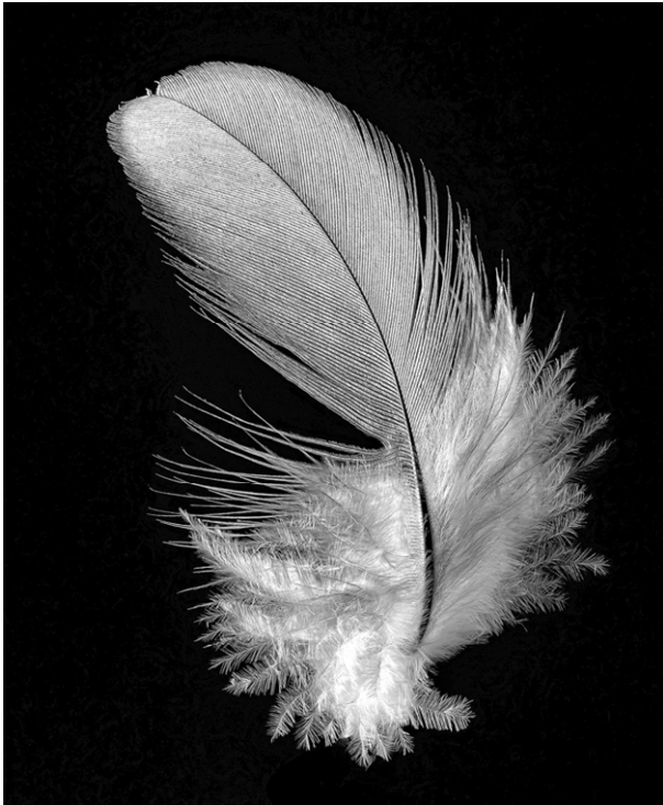
Günter Schmidbaur - Feder